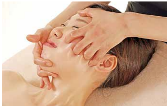
むくみ、たるみによる輪郭のほやけを一掃するレディースの小顔メニュー。フェイシャルの場合でも、肩甲骨・首からしっかりとオールハンドで解していくのがサロンの「肝」とする独自のスタイルだ