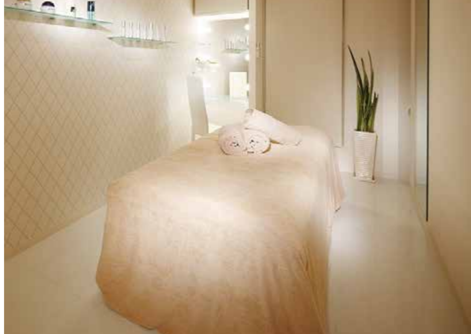
写真はレディース店の施術ルーム。完全個室で施術ルーム内に化粧台も備えているので、ご自身だけの空間で、ゆったりと寛ぐ事ができる。部屋ごとに壁紙が違うのもポイント