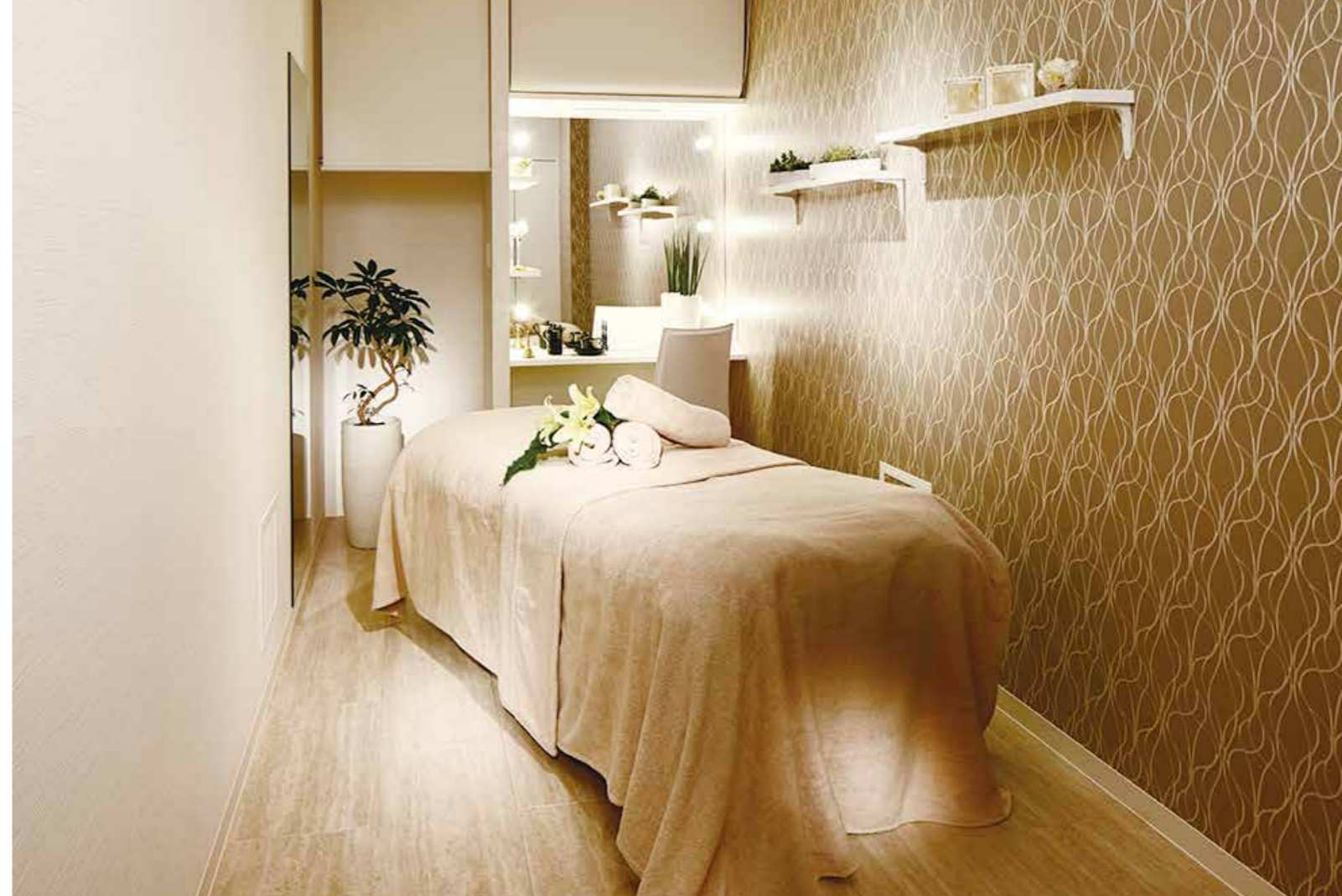
レディース店、メンズ店が隣接しているため、ご夫婦やペアでのご来店も多い。店内は完全にセパレートされ異性に遭遇する心配は無用だ。写真は、シックで落ち着いた空間がお客様を迎えるメンズ店 (Private salon Tk for Men) の施術ルーム。メンズ店は会員制で、ご紹介のお客様が8割を占めている