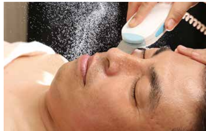
小顔から毛穴ケアまでメンズのフェイシャルメニューも充実度が高い。写真は、何度もメディアで取り上げられているサロン自信の毛穴洗浄。メンズの身だしなみ一環として人気のメニューだ