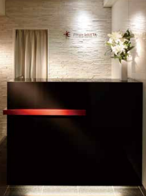
レディース店 (Private salon TK) のサロン エントランス。上質な設えに気分も上がる